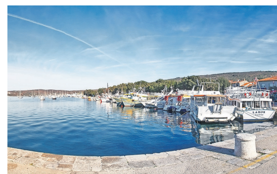
U Puntar (zona Puncala) slijedi sanacija oi proširenje bale te gradnja gata – radovi vrijedni više milijuna kuna