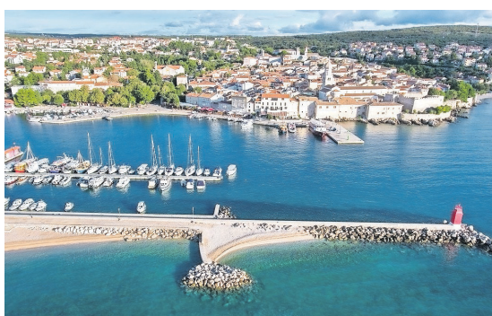
U krčkoj luci nakon sezone u planu je sanacija cijelog istočnog obalnog zida, najavljuje ravnatelj Lajnert